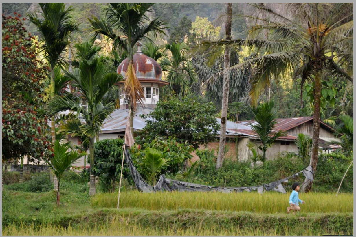
Vallée de l'Harau, Pays Minangkabau, Sumatra-Ouest, Indonésie.