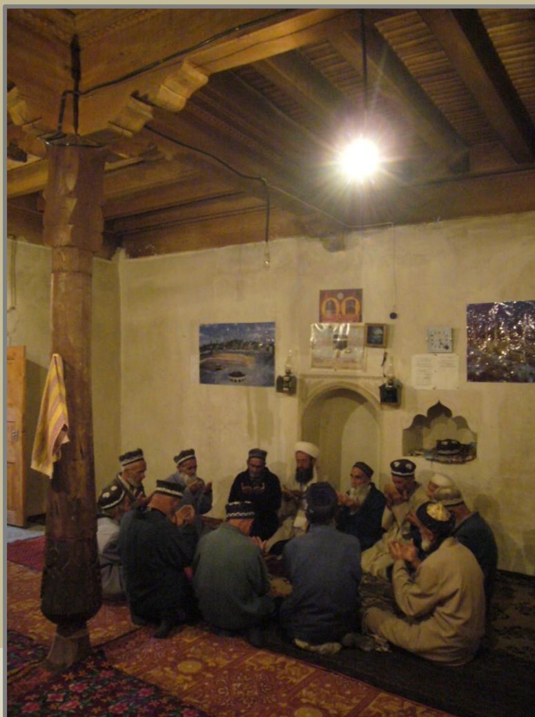
Photo : "Dhikr de l'enclume" performé à l'aurore par un groupe de Qadiris, village de Shamtich, haute vallée du Zerafchan, Tadjikistan (Stéphane A. Dudoignon, 2006)