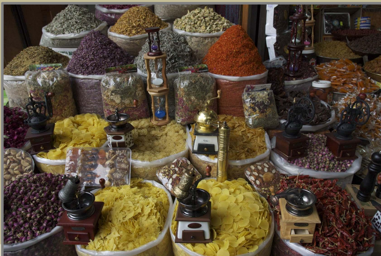
Damas, rue Medhat Pacha, avril 2011