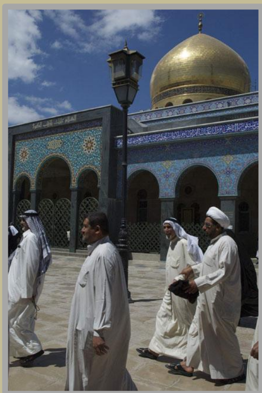
Mausolée de Zaynab, Damas, Syrie