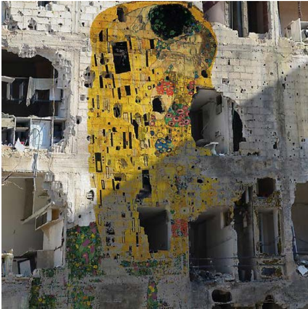
Tammam Azzam, Freedom Graffiti , 2013, lightbox, 75 x 75 cm, edition of 5 - Ayyam Gallery (Dubai)

Cette oeuvre de Tammam Azzam, jeune artiste syrien engagé exilé à Dubaï, a connu un certain succès en 2013 auprès des internautes.