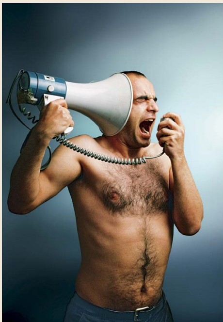
Sener Özmen, Untitled , 2005, photographie, détail de la série du même titre.

Le programme vous sera envoyé très prochainement.