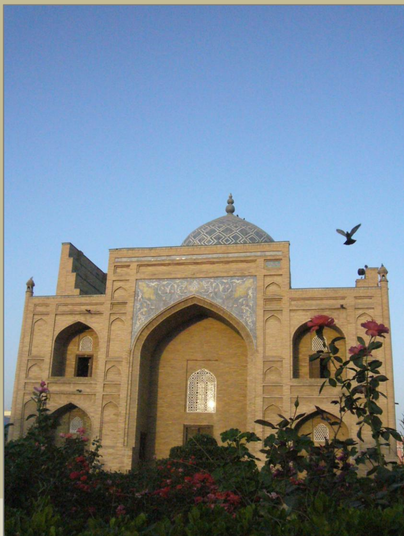
Mausolée de Shaykh Maslahat al-Din (XVe siècle) Khoudjand nord Tadjikista 2007-2008