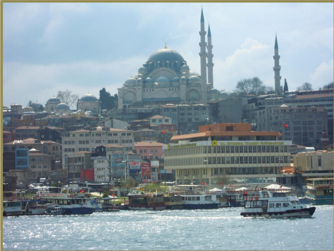
Istanbul, Mars 2012, photo Nathalie Bernard-Maugiron